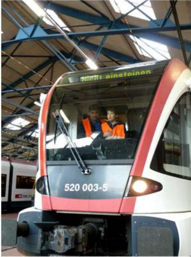
Mit bis zu 160 Kilometern pro Stunde rauschte der Schnellzug von Luzern nach Zürich mit Kevin als Assistenz-Lokführer.