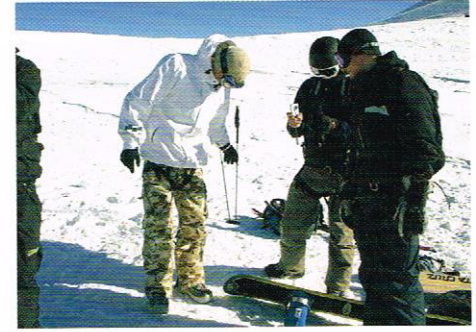
Auf dem Petersgrat.