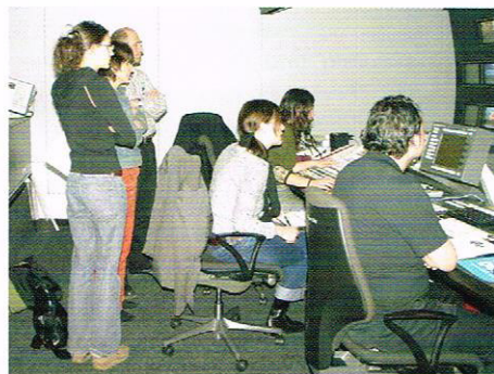
Dem Regisseur über die Schultern blicken.