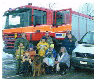
Feuerwehrauto der Brändle AG.