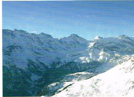
Herrliches Berner Oberland.