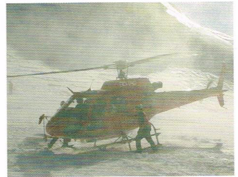
Landung auf 3'207 m ü. M.