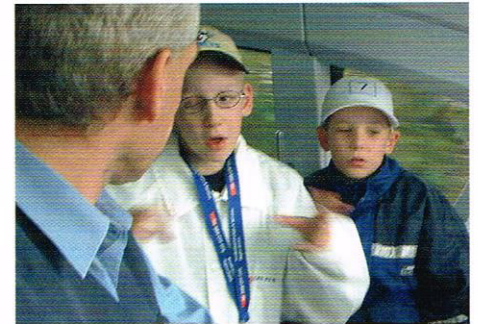
Die SBB-Mitarbeiter haben alles genau erklärt.