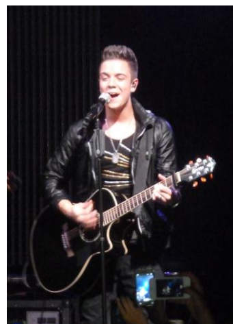
Luca Hänni zeigt sein musikalisches Können.